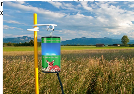
Effektive Rehkitz-Rettung dank modernster Elektronik